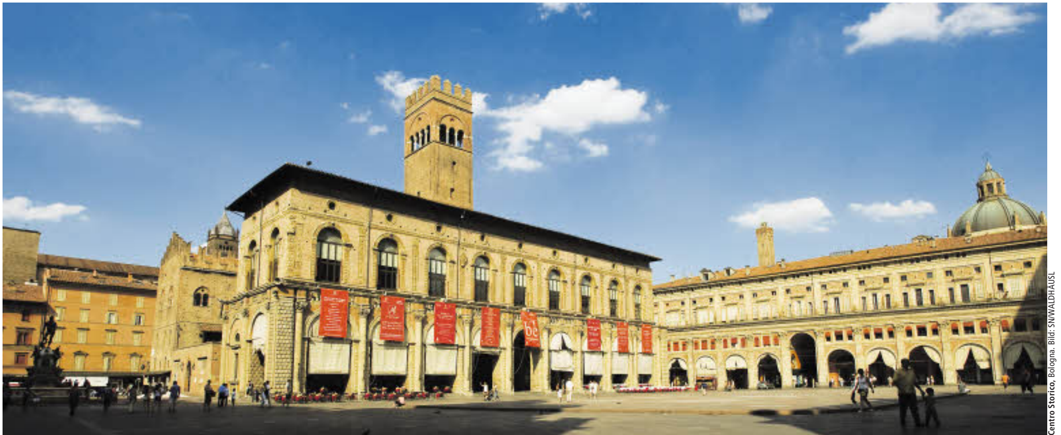
Centro Storico, Bologna.